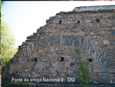
Ponte da antiga Nacional 2 - SRD