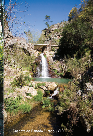
Cascata do Penedo Furado - VLR