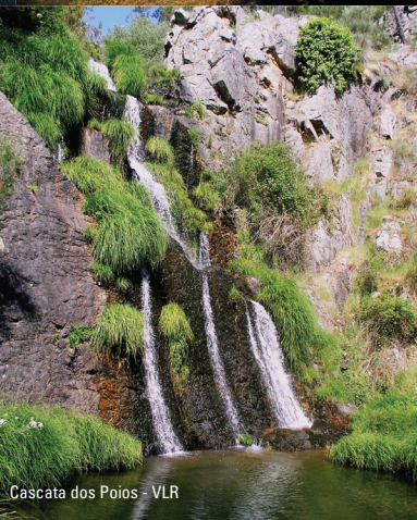
Cascata dos Poios - VLR