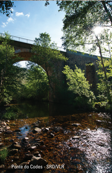
Ponte do Codes - SRD/VLR