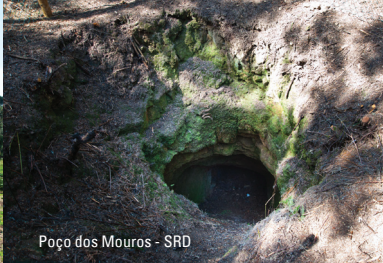
Poço dos Mouros - SRD