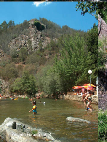
Penedo Furado - VLR